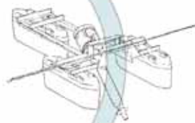
установка на понтон