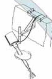
установка на стену